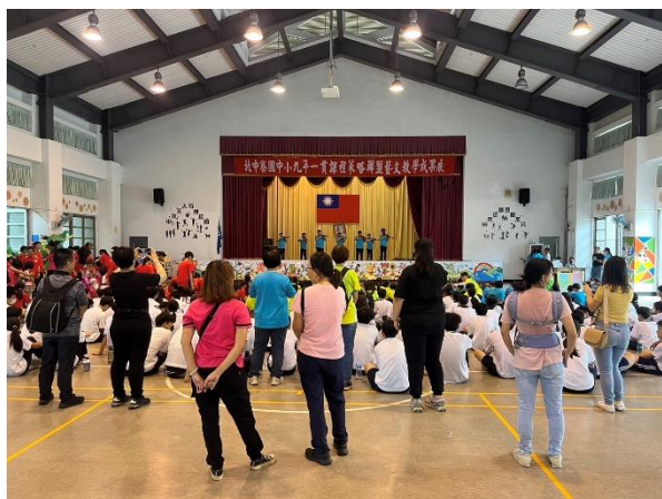
家長觀看本地國小的表演