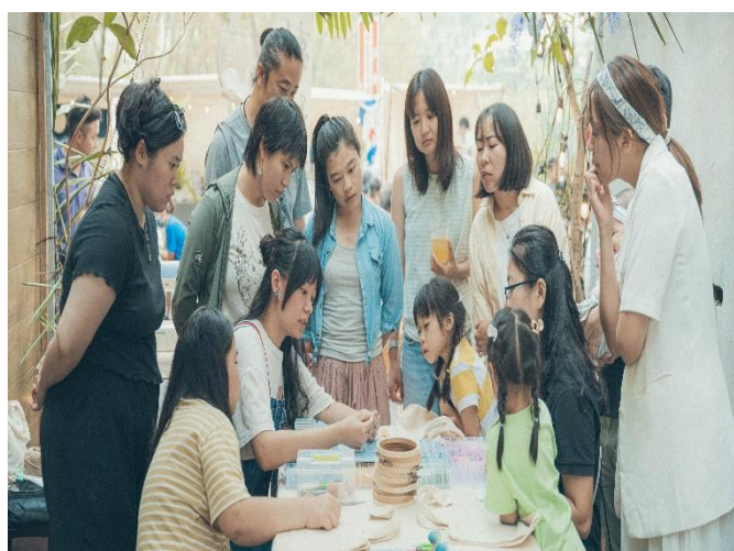
工作坊培養社區有藝術天分的孩子精進