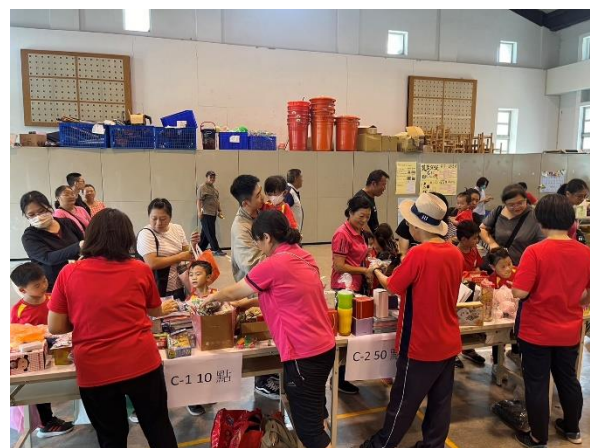
國小家長正挑選商品