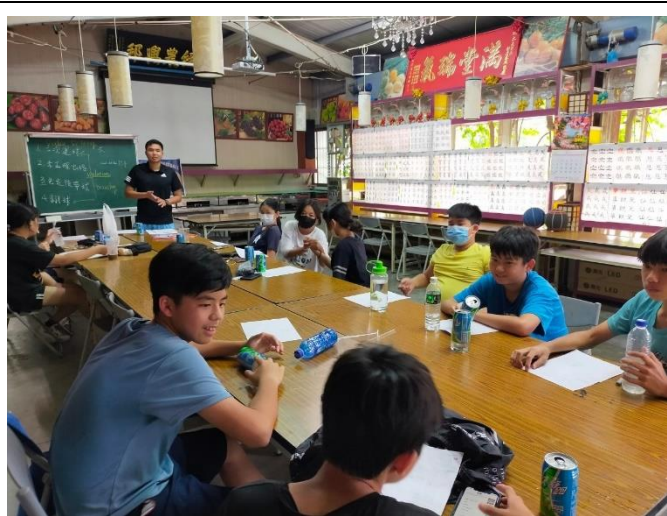
學生正在背誦術語之英語