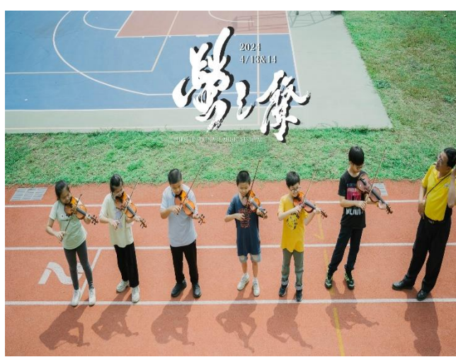
工作坊舉辦假日營隊