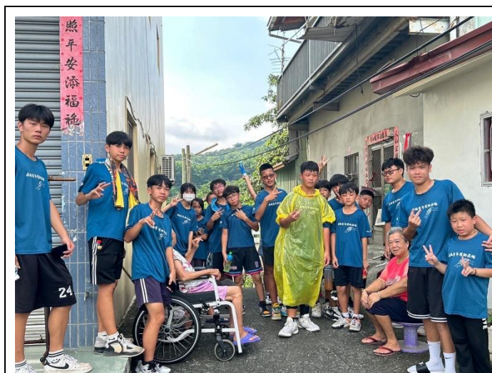
爽中青年軍與學員前往關心長輩