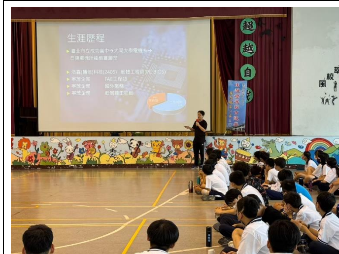
陳爸爸分享生涯發展歷程