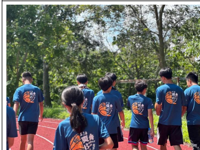
學員正往下個活動場地移動