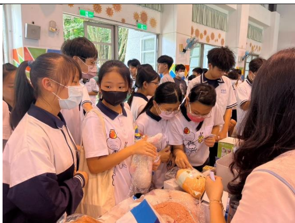
國中的孩子正在挑選物品