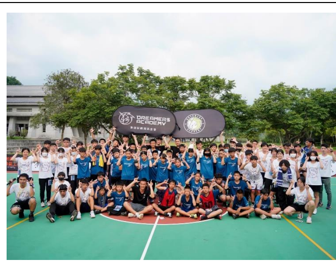
爽中青年軍與學員家長全體合照