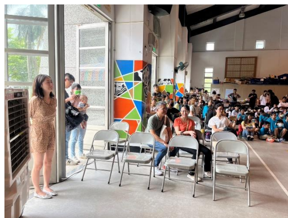
家長認真觀賞藝文表演