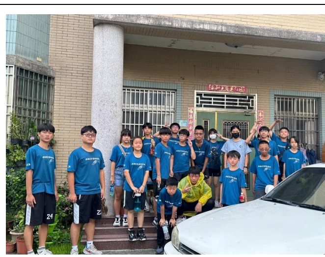
爽中青年軍與學員在長輩家前合照