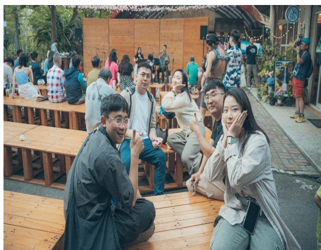
家長在工作坊進行葉拓活動