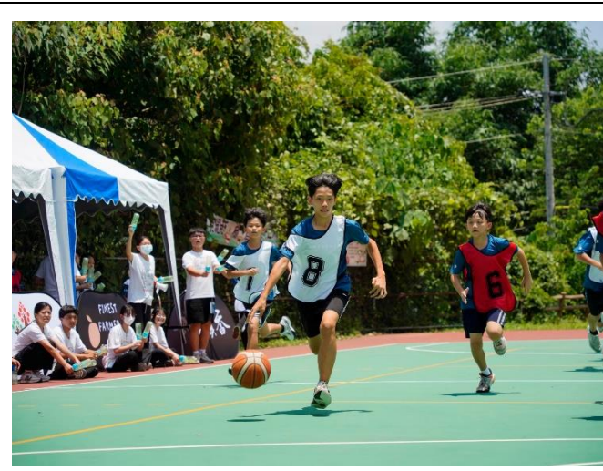
學員正在進行快攻