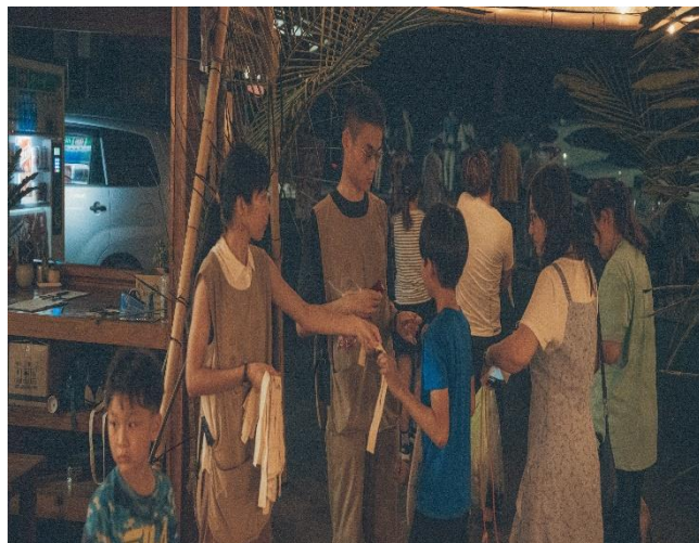
工作坊講師進駐辦理藝術性社團