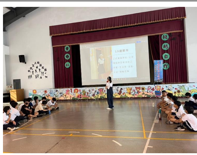
李媽媽分享百貨公司的生涯歷程