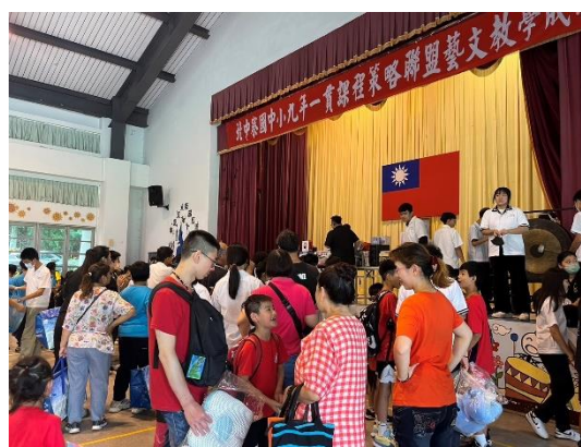
家長正在競拍商品