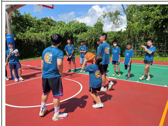
女學員在練習投籃