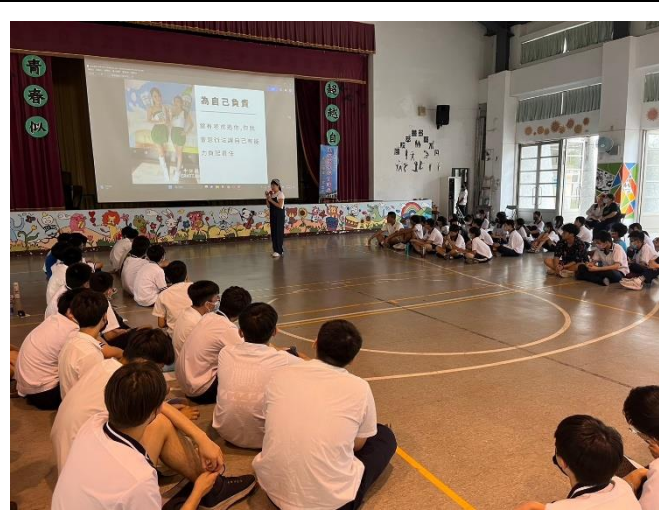
李媽媽分享青少年的經歷