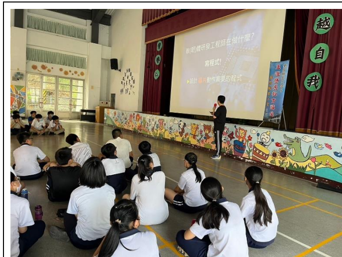
陳爸爸說明工作內容