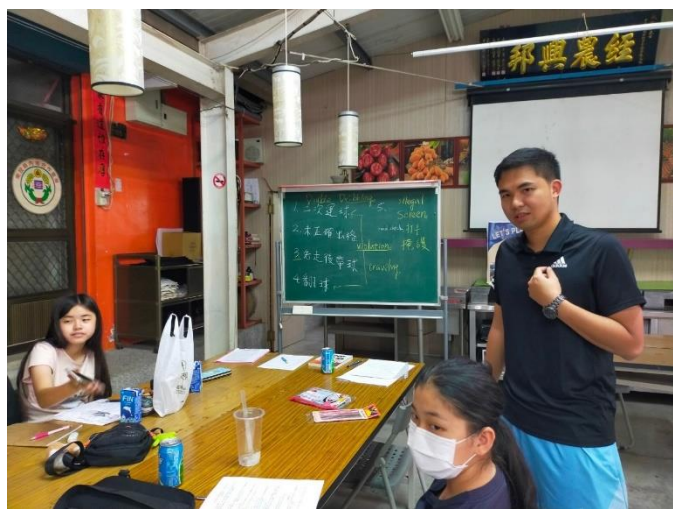
教練教導籃球術語