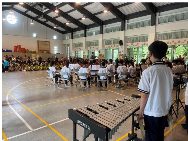
本校國樂團在家長學弟妹面前展現才藝