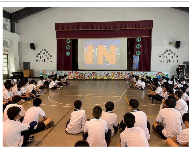
陳爸爸分享播放公司影片