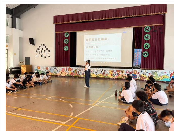
李媽媽分享工作內容