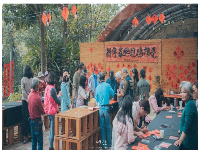
工作坊舉辦社區親子活動