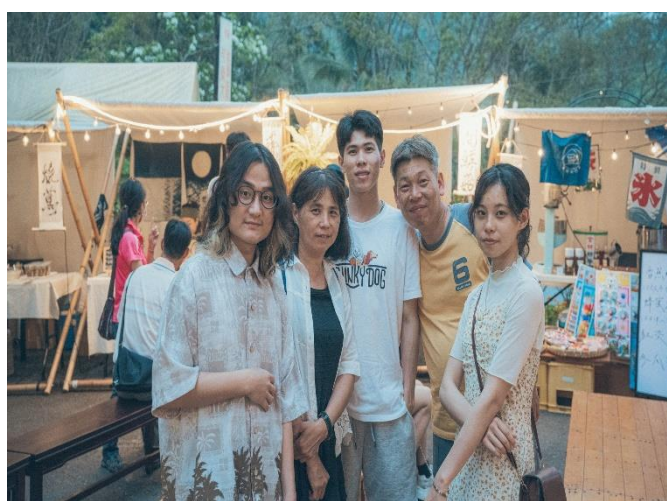
工作坊協助學校進行暑期課程