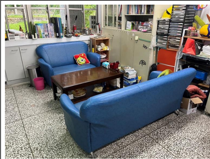
親師生溝通討論區