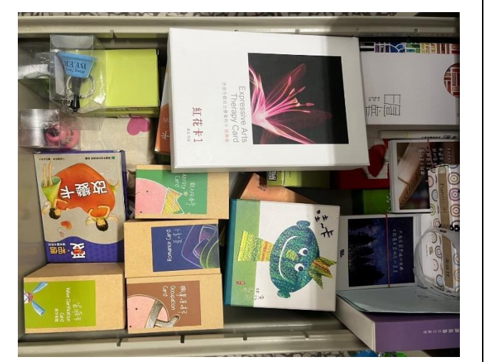
輔導及親子互動相關卡片