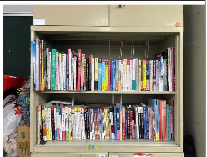
家庭教育相關書籍