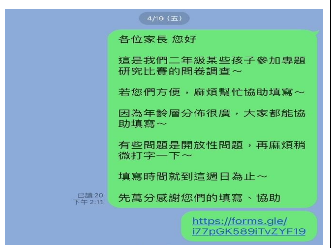
導師與家長溝通群組