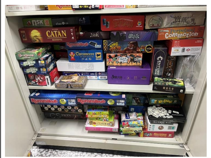
輔導及親子互動桌遊