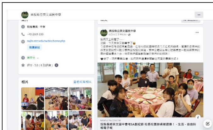
學校臉書粉絲專頁