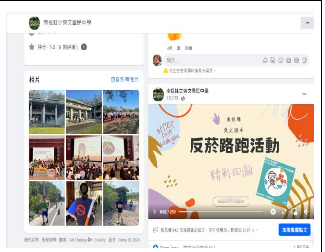
學校提供家長瞭解學校近況的平臺。