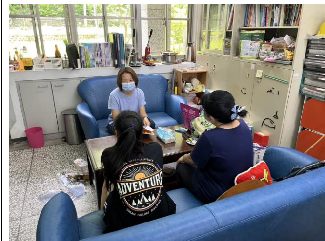
輔導室與諮商室作為親師討論空間。