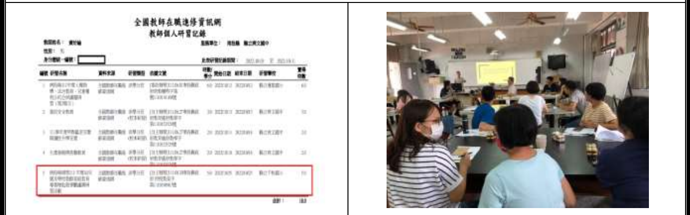
專輔教師參加 111/10/25 之家庭教育研習