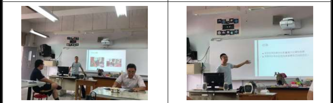
分享不同卡片使用心得